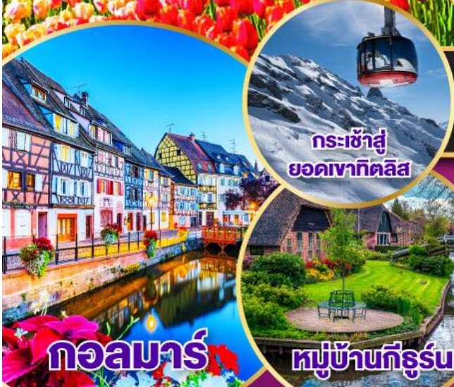
กระเช้าสู่ยอดเขาคิลิส

ถ่ายรูปคู่กับประตูดินและหอไอเฟล สัญลักษณ์กรุงปารีส