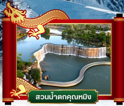
สวนน้ำตกคุนหมิง

✓ พิเศษ! โชว์จางอวีโหม่ว "ความประทับใจลี้เจียง"