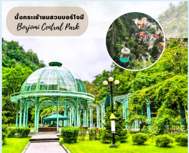
นั่งกระเช้าชมสวนบอร์โจมี Borjomi Central Park

โดยการแช่น้ำแร่ในวันหยุด จากนั้นนำท่านนั่งกระเช้าสู่จุดชมวิวบนหน้าผาเหนือสวนบอร์โจมี