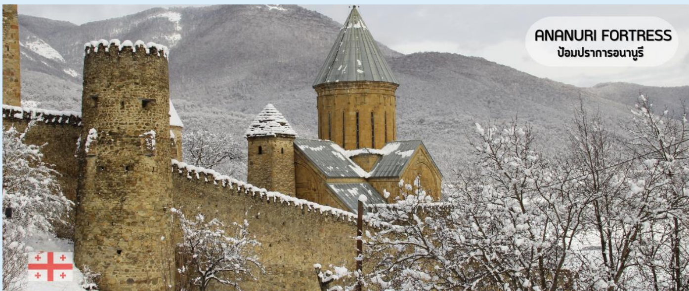
ANANURI FORTRESS ป้อมปราการอนานูรี

แฉะชมป้อมปราการอนานูรี (Ananuri Fortress) ป้อมปราการที่มีความเก่าแก่ของประเทศจอร์เจีย สร้างขึ้นในศตวรรษที่ 16-17 ตั้งอยู่ริมแม่น้ำ Aragvi หนึ่งในแม่น้ำสายสำคัญของประเทศจอร์เจียจากมุมสูง มีทิวทัศน์ความสวยงามของอ่างเก็บน้ำชินวาตี (Zhinvali Reservoir) และยังมีเขื่อนซึ่งเป็นสถานที่ที่สำคัญสำหรับนำน้ำที่เก็บไว้ส่งต่อไปยังเมืองหลวง พร้อมใช้ผลิตกระแสไฟฟ้า ที่ทำให้ชาวเมืองทบิลีซีมีน้ำไว้ดื่มใช้ ร่องรอยของซากกำแพงที่ล้อมรอบป้อมปราการแห่งนี้เปรียบเสมือนม่านที่ซ่อนเร้นความงดงามของโบสถ์ 2 หลัง ที่เป็นโบสถ์เก่าแก่ 2 หลัง คือโบสถ์เก่าแก่แห่งพระนางแมรี่ผู้บริสุทธิ์ (The older Church of the Virgin) ส่วนอีกโบสถ์คือโบสถ์ยิ่งใหญ่แห่งอัสสัมชัญ