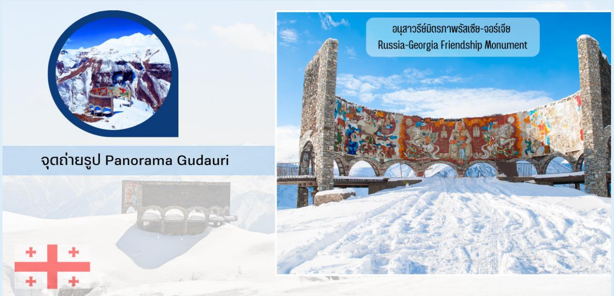
จุดถ่ายรูป Panorama Gudauri