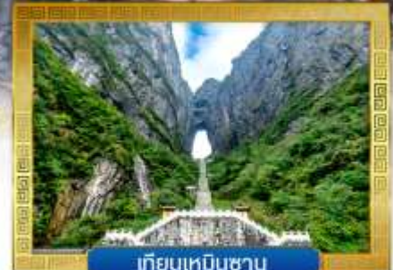
เทียนเหมินซาน