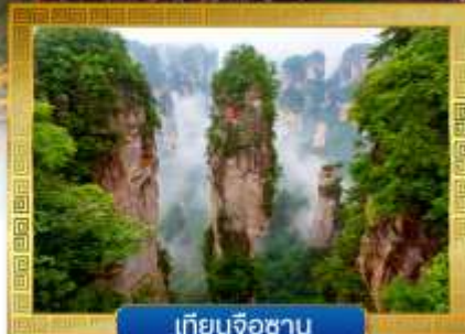
เทียนจื่อซาน

✓ นั่งกระเช้าขึ้นสู่... ภูเขาประตูลสวรรค์