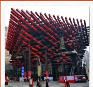
พิพิธภัณฑ์ศิลปะฉงชิ่ง