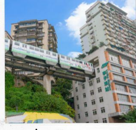
นั่งรถไฟทะลุตึก