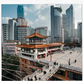
ตึกหุยซิง (ตึก 22ชั้น)