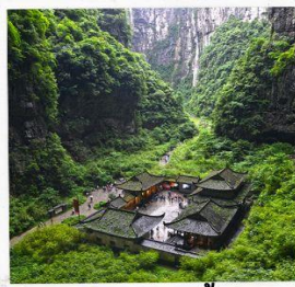
อุทยานหลุมฟ้า สะพานสวรรค์