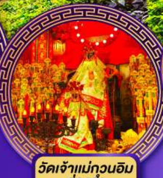
วัดเจ้าแม่กวนอิม ฮองฮ่า