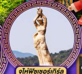
จูไห่พีชชอร์เทิร์ล