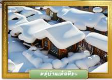
หมู่บ้านเห็ดหิมะ