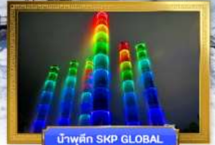
น้ำพุตึก SKP GLOBAL