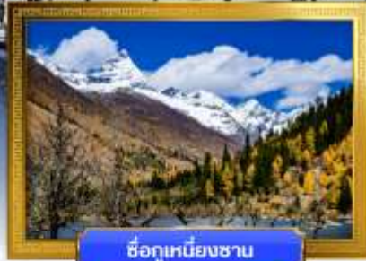
ชื่อภูเขาเหมียงชาน