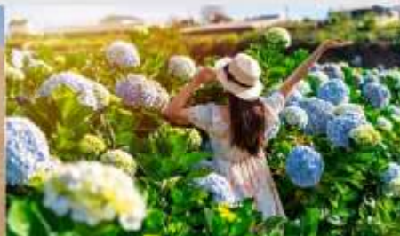
สวนดอกไฮเดรนเยีย