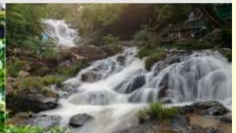
น้ำตกดาตันลา

*ทางบริษัทฯ ขอสงวนสิทธิ์ในการสลับโปรแกรมทัวร์ตามความเหมาะสมขึ้นอยู่กับสถานการณ์หน้างาน โดยคำนึงถึงผลประโยชน์ของลูกค้าเป็นสำคัญ