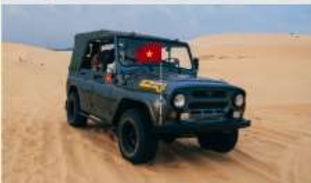
ทะเลทรายขาว