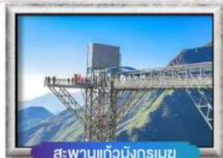
สะพานแก้วมิงกรเมซ