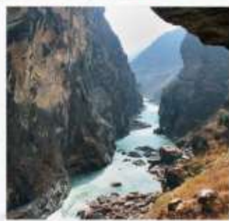
ช่องแคบเสือกระโดด