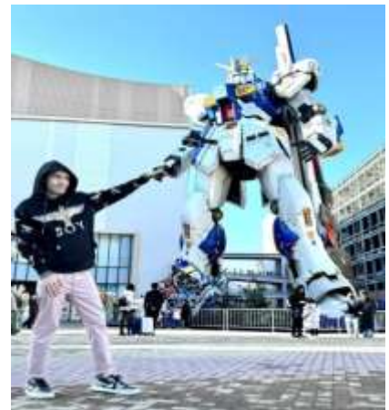
หุ่นกันดั้ม ชื่อ RX93 FF Nu Gundam

เดินทางต่อไปยัง ร้านค้า DUTY FREE ให้ท่านได้ช้อปปิ้งสินค้าปลอดภาษีที่มีคุณภาพ อาทิ เครื่องสำอาง โฟมล้างหน้า(แนะนำ) อาหารเสริม ขนม เครื่องใช้ต่างๆ ฯลฯ ...จากนั้นแวะ แซะรูปกับหุ่นกันดั้มยักษ์ ณ ห้าง LaLaport (หากมีเวลาพอ) มีขนาดใหญ่กว่า Unicorn Gundam ที่โตเกียวและใหญ่กว่า RX93 FF Gundam ที่ Gundam Factory Yokohama เรียกได้ว่าเป็นแลนด์มาร์คสำคัญของเมืองฟูกุโอกะในปัจจุบัน ...จากนั้นอิสระให้ท่านช้อปปิ้งขนาดใหญ่ใจกลางเมือง รวบรวมแหล่งบันเทิง อย่างครบครัน ไม่ว่าจะเป็นตึกต้นไม้ ร้านค้าที่น่าสนใจ และบรรยากาศสุดคลาสสิก หรือจะเป็นย่านของกินอร่อยๆ อย่างย่านยะไต (Yatai) หมายถึง ชุ้มขายอาหารที่มีขนาดไม่ใหญ่มาก ที่รวมร้านอาหารแบบฉบับท้องถิ่นเอาไว้มากมาย