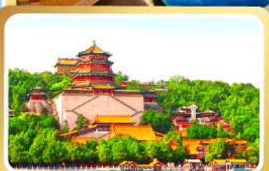
พระราชวังฤดูร้อนอี้เหอหยวน