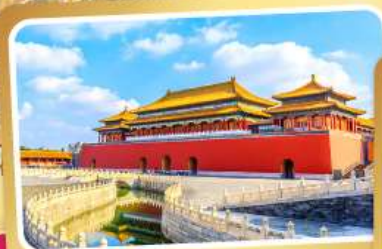
พระราชวังโบราณถู๊ง