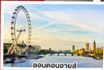
ลอนดอนอายส์