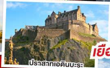
ปราสาทเอดิเนบะระ