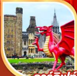
คาร์ดิฟฟ์