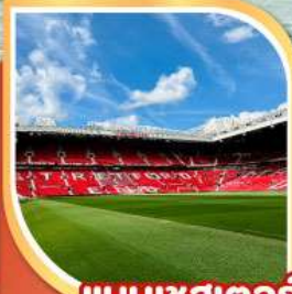
แมนเชสเตอร์

19-26 ธ.ค.67 | 26 ธ.ค.-02 ม.ค.68 23-30 ม.ค.68 | 20-27 ก.พ.68 06-13 มี.ค.68 | 20-27 มี.ค.68