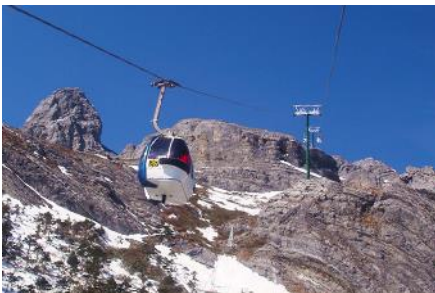
ภูเขาหิมะมังกรหยก (น้ำกระช้ำใหญ่)

ที่พัก FENG HUANG HOTEL ระดับ 4 ดาว หรือเทียบเท่าเมืองลี่เจียง