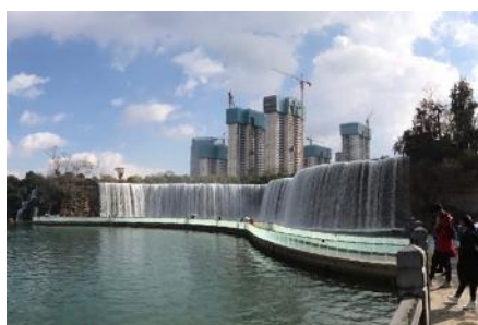
สวนน้ำตก Kunming Waterfall Park

พักที่ VIENNA HOTEL ระดับ 4 ดาว หรือเทียบเท่าในเมืองคุนหมิง