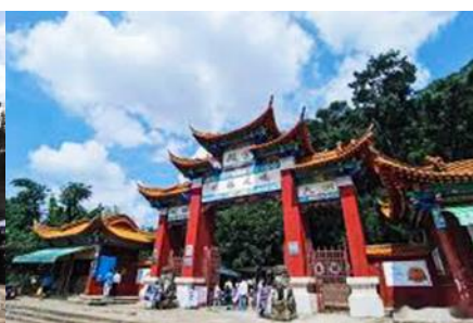
ตำหนักทองจินเตี้ยน