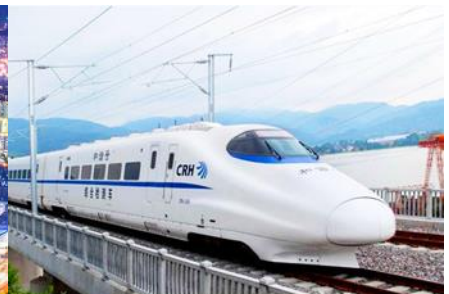
บึงรถไฟความเร็วสูง