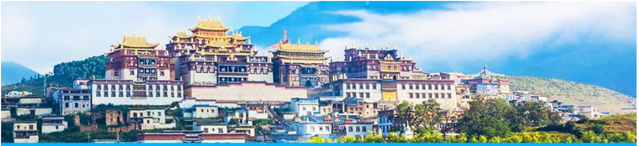
เมืองโบราณแซงกริล่า

จากนั้นนำท่านชม หมู่บ้านชีโจวหรือหมู่บ้านชาวไต้ ชนพื้นเมืองที่สำคัญของเมือง ชมการแสดงของชนชาติป๋ายพร้อมชิมชาสามแก้ว เพื่อรำลึกถึงวิถีชีวิตและการเกิดมาเป็นมนุษย์ของตนเอง ซึ่งถือเป็นเอกลักษณ์ของชนชาวไต้ ที่หาดูได้ยาก