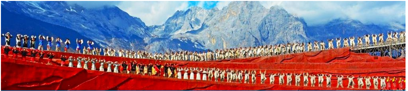
การแสดง IMPRESSION LIJIANG

หลังอาหารนำท่านชมการแสดง IMPRESSION LIJIANG โชว์อันยิ่งใหญ่โดยผู้กำกับชื่อก้องโลก “จาง อี้โหมว” ได้เนรมิต ให้ภูเขาหิมะมังกรหยกเป็นฉากหลัง และบริเวณทุ่งหญ้าเป็นเวทีการแสดง โดยใช้นักแสดงกว่า 600 ชีวิต แสง สี เสียง การแต่งกายตระการตาเล่าเรื่องราวชีวิตความเป็นอยู่ และชาวเผ่าต่างๆ ของเมืองลี่เจียง