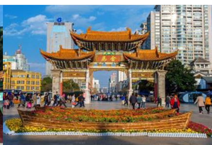
ซุ้มประตูโบราณ บ้ากอ ไก่หยก

วันที่หก คุนหมิง - KUNMING WATERFALL PARK – ตำหนักทองจินเตี้ยน - ซุ้มประตูโบราณ ม้าทอง ไก่หยก - ร้าน POP MART (ตามหาบุญ) - กรุงเทพฯ (สุวรรณภูมิ)