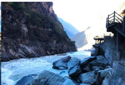
ช่องแคบเสือกะโรจน