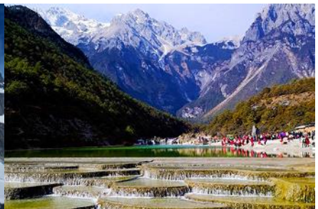
หุบเขาพระจันทร์สีน้ำเงิน "ปู้ซู่เหอ"