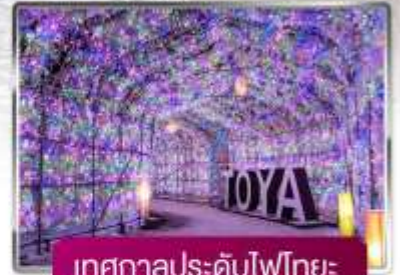
เทศกาลประดับไฟไทยะ