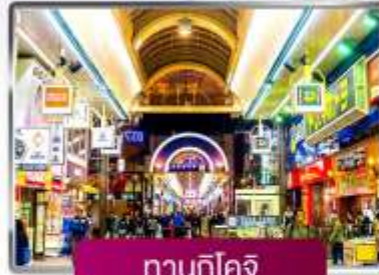
ทานุกิโคจิ