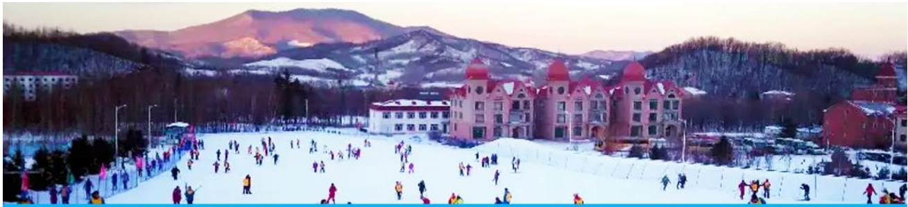
ลานสกียาบูลิ

วันที่สาม เมืองฮาร์บิน-ลานสกียาบูลิ-ชมการจับปลาฤดูหนาว-หมู่บ้านหิมะ Snow Town-ระเบียงชม วิวปั้งจฺยฺซาน-ถนน Xue Yun Da Jie