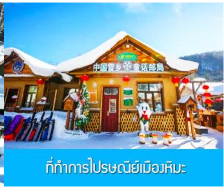
ที่ทำการไปรษณีย์เมืองหิมะ

วันที่สี่ พิพิธภัณฑที่เมืองหิมะ – ที่ทำการไปรษณีย์เมืองหิมะ - ไกด์ขายออฟชั่นภาพเขียนสิบลี้-และออฟชั่น ม้าลากเลื่อน-เมืองฮาร์บิน