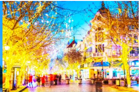
ถนนมายังลู

วันที่ห้า เมืองฮาร์บิ้น – โบสถ์โซเฟีย - อนุสาวรีย์ป้องกันอุทกภัย-ถนนจงยาลู – นั่งรถไฟความเร็วสูงกลับเมืองต้าเหลียน – จัตุรัสซิงไห่ – ถนนรัสเซีย