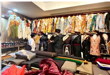
ศูนย์จำหน่ายอุปกรณ์กีฬาหนาว