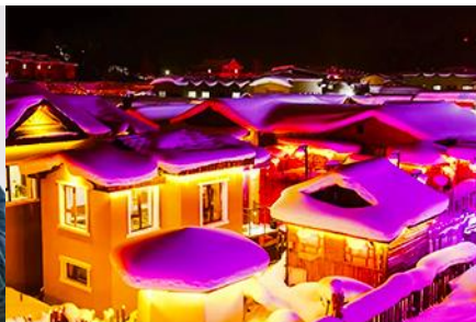
เมืองหิมะ Xue xiang