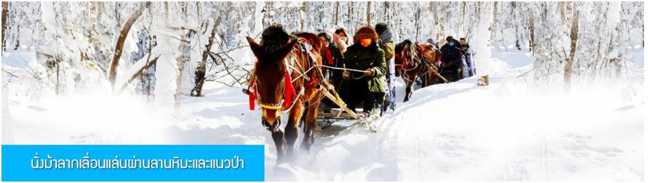
นั่งม้าลากเลื่อนเล่นผ่านลานหิมะและแนวป่า

รายการที่ 2 นั่งม้าลากเลื่อนเล่นผ่านลานหิมะและแนวป่า 马拉雪橇 ท่ามกลางสิ่งแวดล้อมของหิมะราวกับอยู่ในโลกแห่งเทพนิยาย ผ่านหมู่บ้าน เว่ยหูจ้าย 威虎寨 ที่อดีตเคยเป็นที่ตั้งของรังโจรที่มักออกปล้นสะดมชาวบ้าน ม้าลากเลื่อนเป็นยานพาหนะเฉพาะพื้นที่ ๆ ได้รับความนิยมมากในอดีต การเดินทางในช่วงฤดูหนาวต้องใช้ม้าลากจูงลากเลื่อนให้สามารถวิ่งเล่นบนลานหิมะได้ โดยลากเลื่อนที่มีม้าเป็นตัวลากจูงสามารถถ้ำได้ถึงทั้งผู้คน และข้าวของเสบียงต่าง ๆ .....เวลาที่ใช้สำหรับโปรแกรมเสริมนี้ประมาณ 40 นาที อัตราค่าบริการ ท่านละ 240 หยวน หรือ 1200 บาท อัตรานี้รวมค่าบริการผ่านเข้าอุทยาน ค่ารถรับ ส่ง และค่าบริการของไกด์ท้องถิ่น และค่าบริการจัดการของบริษัททัวร์ท้องถิ่น.. หมายเหตุ โปรแกรมเสริมเป็นโปรแกรมที่ท่านต้องเสียค่าใช้จ่ายเองด้วยความสมัครใจ สำหรับท่านที่ไม่เข้าร่วมกิจกรรมดังกล่าวสามารถนั่งพักในรถได้