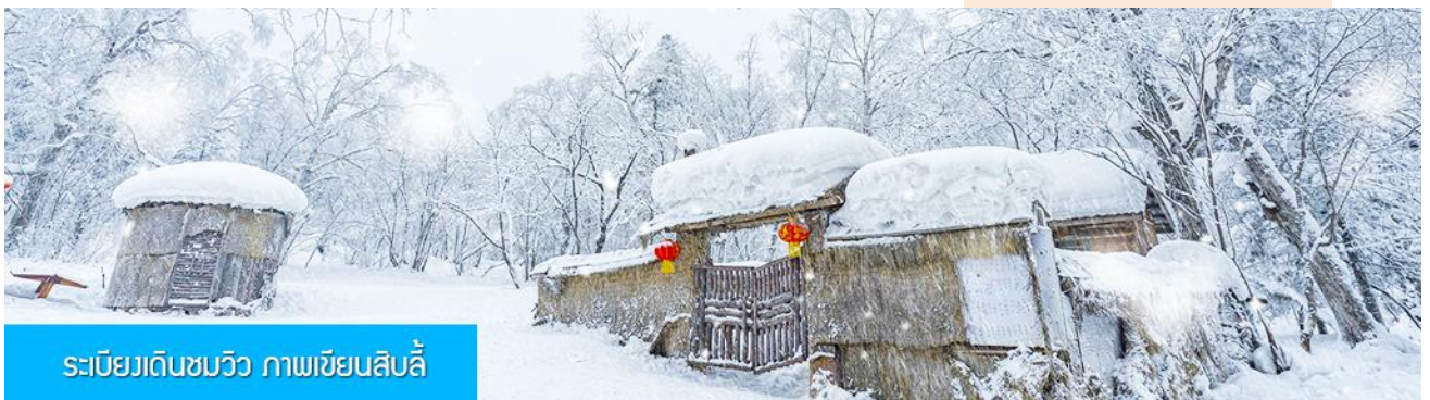
ระเบียบเดินชมวิว ภาพเขียนสิบลี้

ระหว่างทางไกด์ท้องถิ่นจะเสนอขายโปรแกรมเสริมที่ไม่ได้รวมในค่าทัวร์ (ออฟชั่นแนล ทัวร์) 2 รายการ