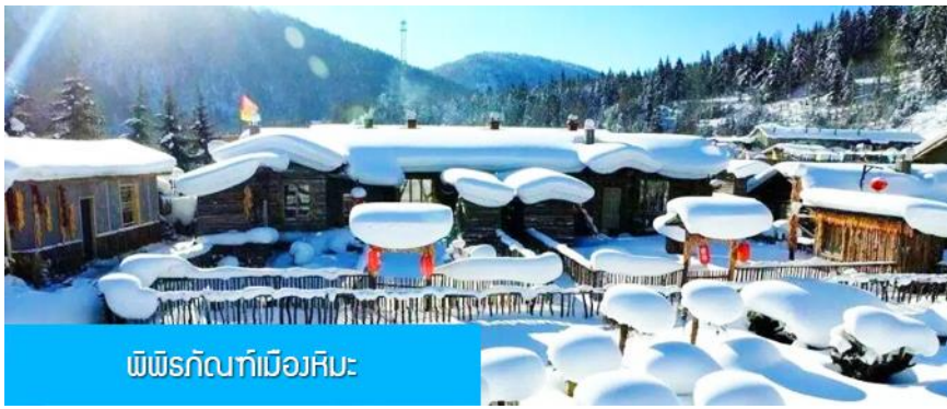
พิพิธภัณฑที่เมืองหิมะ