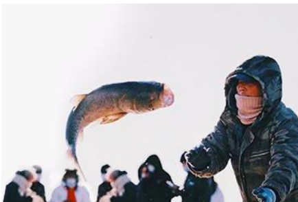
การจับปลาในฤดูหนาว

นำท่านชม การจับปลาในฤดูหนาว 冬捕 เป็นวิธีการจับปลาตามแม่น้ำและแหล่งน้ำในฤดูหนาวที่สืบทอดกันมาช้านาน โดยชาวบ้านจะนำแหดักปลามาวางดักไว้ตามจุดต่าง ๆ ก่อนที่ผิวน้ำจะปกคลุมด้วยน้ำแข็ง หลังจากผิวน้ำกลายเป็นน้ำแข็งแล้ว ชาวบ้านจะเจาะพื้นน้ำแข็งบริเวณที่มาวางดักอยู่เพื่อยกแหขึ้น จะมีปลาติดแหเป็นจำนวนมาก...พิเศษ ให้ท่านได้ชมการยกแหดักปลาจากสถานที่จริง และให้ท่านได้ชิมซุบน้ำปลาดิบ ๆ ที่ได้จากแหดักปลา