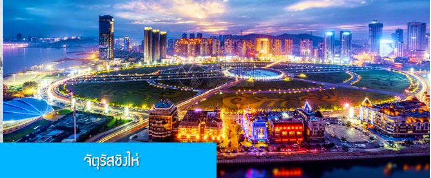
จัตุรัสชิงไห่