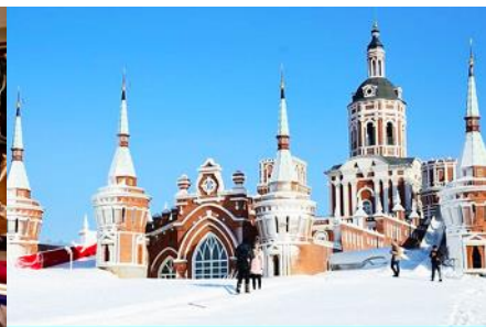
สวน LITTLE RUSSIA