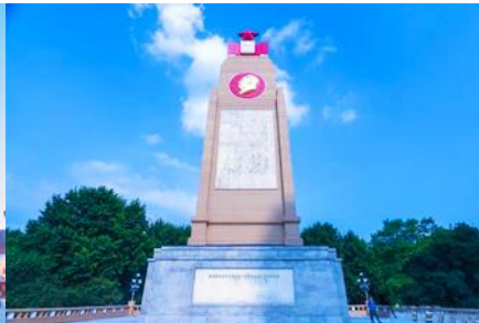
อนุสาวรีย์ฟิงหวง