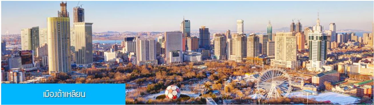
เมืองต้าเหลียน