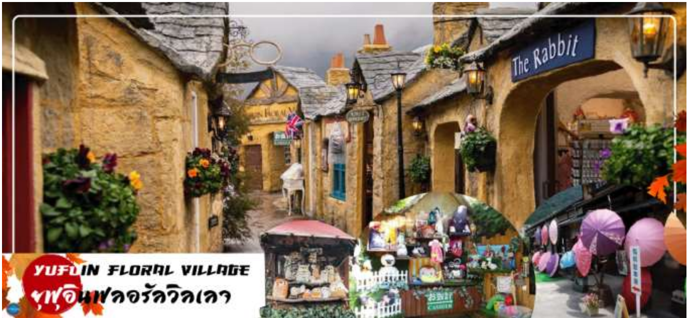
YUFUIN FLORAL VILLAGE ฟูฟุอินฟลอร์วัลลิจเคียว