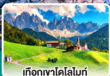
เทือกเขาโดโลไมท์