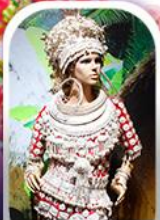
หมู่บ้านชนเผ่า