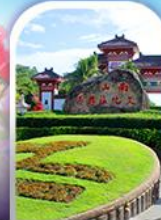
อุทยานหนานชาน