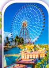
เมืองแฟนตาซี