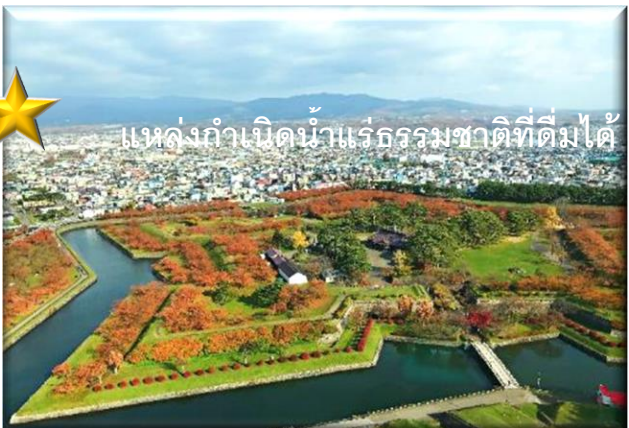
★ แหล่งกำเนิดน้ำแร่ธรรมชาติที่ดื่มได้