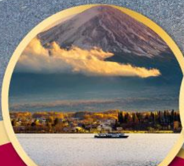
ทะเลสาบคาวากุจิโกะ