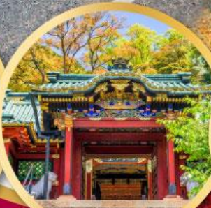
ศาลเจ้าโทโชคุ