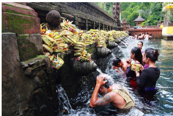
ลูกเต๋มบ้านหลานเต๋มเมือง

นำท่านสู่ วิหารศักดิ์สิทธิ์ เทมภักศิริงค์ สร้างในศตวรรษที่ 13 เป็นวิหารศักดิ์สิทธิ์สมัยโบราณใช้ประกอบพิธีทางศาสนาในราชวงศ์จักรีเมื่อนั้น ชมบ่อน้ำพุศักดิ์สิทธิ์ ที่TIRTA EMPUL ที่ผุดขึ้นจากใต้ดินเป็นพันปี โดยไม่มีวันหมด ชมศิวลิ่งค์ศักดิ์สิทธิ์ และแท่นบูชาเทพที่ศักดิ์สิทธิ์และมหัศจรรย์ ทำเนียบประธานาธิบดีบนเนินเขา ด้านหน้าปากถ้ำเป็นสระศักดิ์สิทธิ์ มีน้ำไหลพุ่งจากปากปล่องแคะสลักเป็นรูปอสิสตรี 6 นาง ชาวบาหาลีเชื่อว่า ถ้ำใครอยากมีลูก ลงมาตี๋มหรืออาบน้ำที่นี่ จะมี